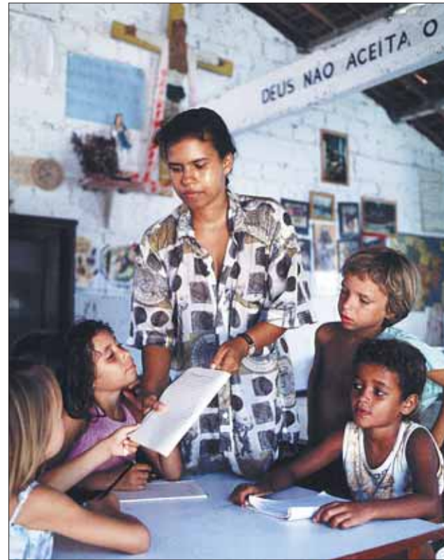
Den christlichen Glauben weitergeben ist Aufgabe von Katechisten wie hier im brasilianischen Amazonas-Gebiet.

Heilsbotschaft überall auf Erden von allen Menschen erkannt und angenommen wird“, heißt es darin. Das Dekret geht besonders auf die Diasporasituation ein. „Das persönliche Apostolat hat ein besonderes Wirkungsfeld in den Ländern, in denen die Katholiken eine Minderheit bilden und in der Diaspora leben.“ (Art. 18) Das Konzil hat nicht nur die Arbeit von Laien in der Pastoral gefördert, sondern auch die Grundlagen für weitere Entwicklungen gelegt. Neben einzelnen beauftragten Laienhelfern sind es heute zunehmend Gemeinschaften von Laien, die die Verantwortung für die Weitergabe des Evangeliums tragen.