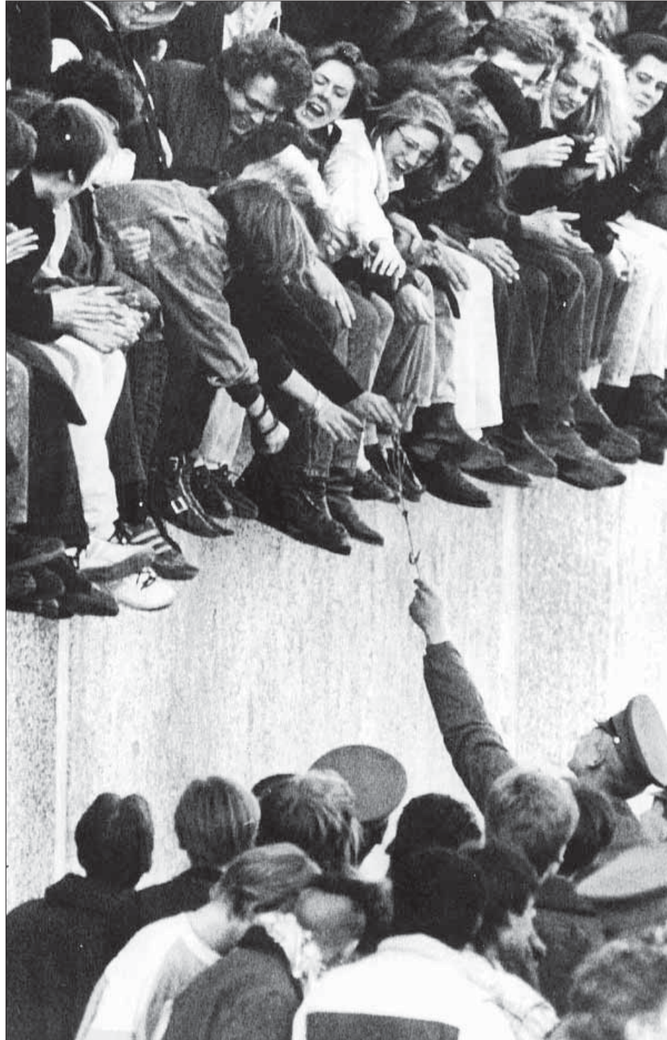
Die Mauer hatte plötzlich ihre Schrecken verloren: Lachende Menschen kletterten auf der Berliner Mauer, und fröhliche Wachposten sahen ihnen dabei tatenlos zu: Diese Bilder der friedlichen Revolution gingen am 10. November rund um die Welt.

Zur Mauer von Westen her! Oben standen dichtgedrängt viele Menschen. Auch wir schafften es mit einiger Anstrengung auf das seltsame Bauwerk. Zwischen uns und dem Brandenburger Tor standen ungewöhnlich viele Grenztruppen-Soldaten, sie bildeten eine lockere Kette und kehrten dem Westen den Rücken zu. Dabei schwatzten sie miteinander, einige rauchten. Un-