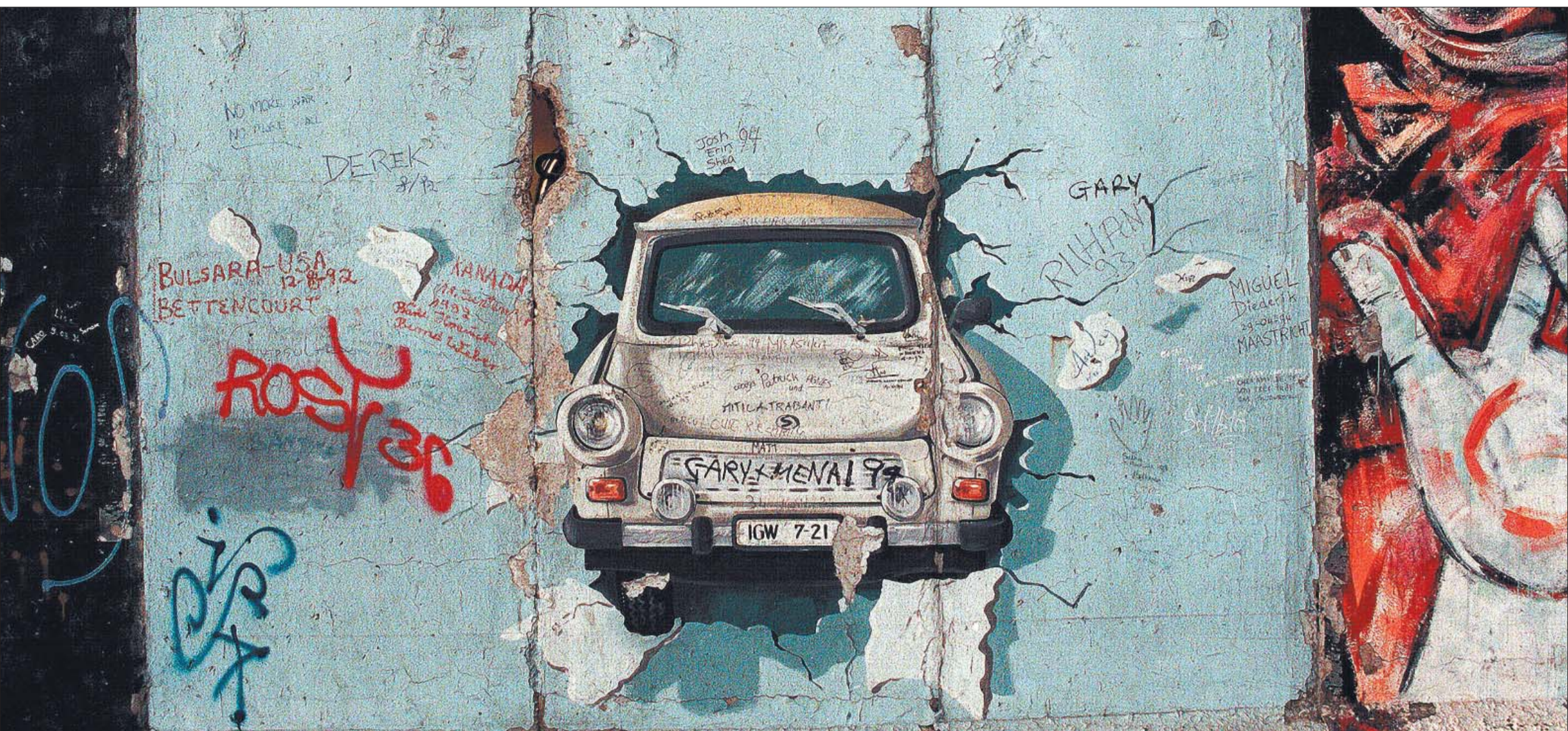
Graffiti an der Berliner Mauer: Der Trabant, der die Grenze passiert, wurde zum Symbol des 9. Novembers 1989. Tausende von Trabis befanden sich wenig später auf Reisen jenseits der Grenze.